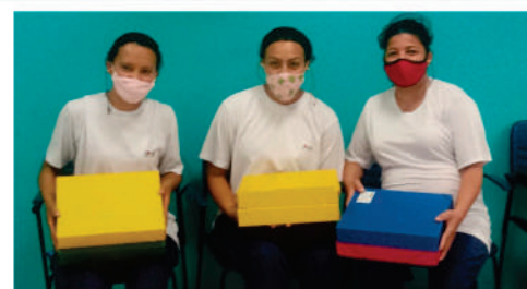
Foto de distribuição de presentes de dia das crianças aos associados do Sindiversão.

Empresas que fazem parte de nossa Rede de Parceiros: