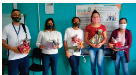
Foto de distribuição de presentes de dia das crianças aos associados do Sindiversão.

REDE DE PARCEIROS: No site do sindicato você encontra inúmeros estabelecimentos que oferecem DESCONTOS ESPECIAIS aos associados, como óticas, escolas profissionalizantes, faculdades, pousadas, etc.