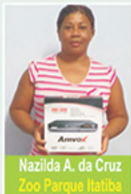
Nazilda A. da Cruz Zoo Parque Itatiba

No mês de Dezembro houveram sorteio e distribuição de lindos Brindes. Veja ao lado algumas fotos dos contemplados.